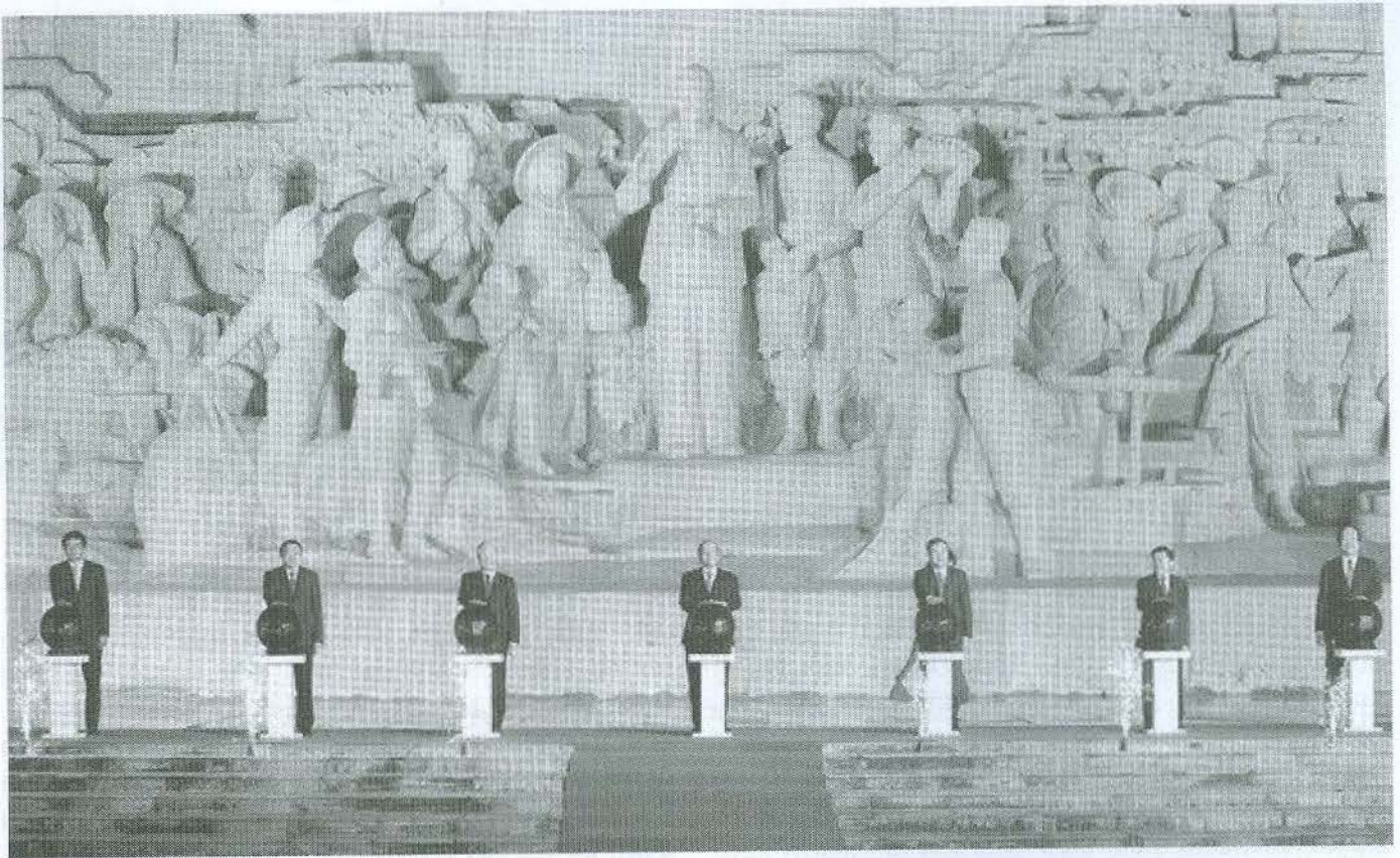
Ngày 12/12/2020: Thủ tướng Nguyễn Xuân Phúc, Thường trực Ban Bí thư Trần Quốc Vượng và lãnh đạo Đảng, Trung ương, lãnh đạo tỉnh Thái Bình nhân nút khánh thành công trình Tượng đài "Bác Hồ với nông dân Việt Nam".

xứng đồng đều, mang tính mỹ thuật cao. Tượng đài Bác Hồ với nông dân Việt Nam không chỉ là công trình văn hóa ý nghĩa, là điểm đến hấp dẫn của Nhân dân cả nước, du khách nước ngoài để tri ân công lao to lớn của Chủ tịch Hồ Chí Minh, đây còn là công trình có giá trị lịch sử, lưu giữ trường tồn những tình cảm Bác Hồ dành cho nông dân Thái Bình, cũng như nông dân cả nước.