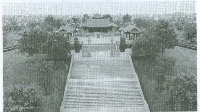
Phía sau Tượng đài là Đền thờ Bác Hồ được xây dựng trên quả đồi cao, uy nghiêm nằm giữa công viên Hoàng Diệu

Lần thứ nhất: Ngay sau ngày Cách mạng tháng Tám năm 1945 thành công, Người căn dặn lãnh đạo tỉnh: Phải đoàn kết toàn dân, đoàn kết các