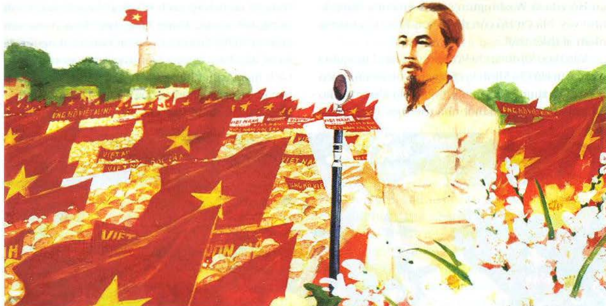
Tác phẩm Bác Hồ đọc Tuyên ngôn độc lập

Yêu thương và quý trọng con người là một trong những đức tính đặc sắc nhất của đạo đức Hồ Chí Minh.