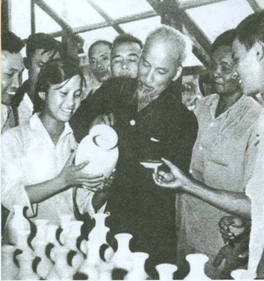
Thăm Nhà máy sứ Hải Dương, Bác Hồ để tặng 4 chữ "Cố gắng, tiến bộ" trên chiếc lọ hoa - sản phẩm của nhà máy (ngày 26-7-1962).

phong cách dân chủ, thân dân và trọng dân. Làm cho Bộ đội Cụ Hồ-danh xưng cao quý mà nhân dân trao tặng, tôn vinh-thực sự là bộ đội của dân, do dân và vì dân. Đó là văn hóa chính trị, văn hóa quân sự sâu xa nhất làm nên sức mạnh bách chiến bách thắng của Quân đội ta.