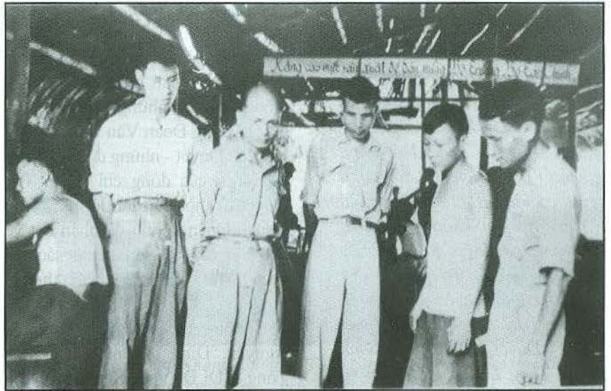
Đồng chí Lê Văn Hiến, Bộ trưởng Bộ Tài chính thăm nhà máy (1949).

5 tháng vượt bao khó khăn, ác liệt, không cần cầu, với mấy xe tải chạy dầu ma dút cũ kỹ, thuyền gỗ, ngựa thồ, đôi vai, công nhân viên tháo dỡ, chuyển trên 1.000 tấn máy móc. Cả nhà máy trên 3.000