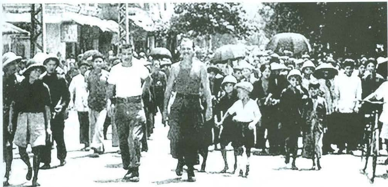
Những người Mỹ của toán OSS trên đường phố Hà Nội sau ngày 2/9/1945

Chúng ta rất tự hào khi biết từ 75 năm trước, Hồ Chí Minh vị lãnh tụ cộng sản của một quốc gia nhỏ bé như Việt Nam đã đòi một quan hệ «hợp tác đầy đủ» với nước tư bản phương Tây số 1 là nước Mỹ. Vị tổng thống chống cộng như Truman lơ Người đã đành, các đồng chí của Người khi ấy chắc không nhiều người tin rằng «cộng sản» có thể «chơi» được với «tư bản». Nhưng Hồ Chí Minh, người từng bốn ba bốn biển năm châu, từng lăn lộn ở cả xã hội tư bản lẫn xã hội cộng sản, hiểu thấu bản chất nhân loại, người được nhà văn Nga Madenstam coi là hiện thân của nền văn hóa thế giới tương lai, từ 75 năm trước đã tin chắc rằng, bất kể mọi khác biệt về ý thức hệ, tôn giáo, chế độ xã hội, sự lớn nhỏ, giàu nghèo, mọi đất nước, mọi dân tộc đều có thể và cần phải làm bạn với nhau, «hợp tác đầy đủ» với nhau. Đó là chân lý lớn nhất của thế giới hiện đại.