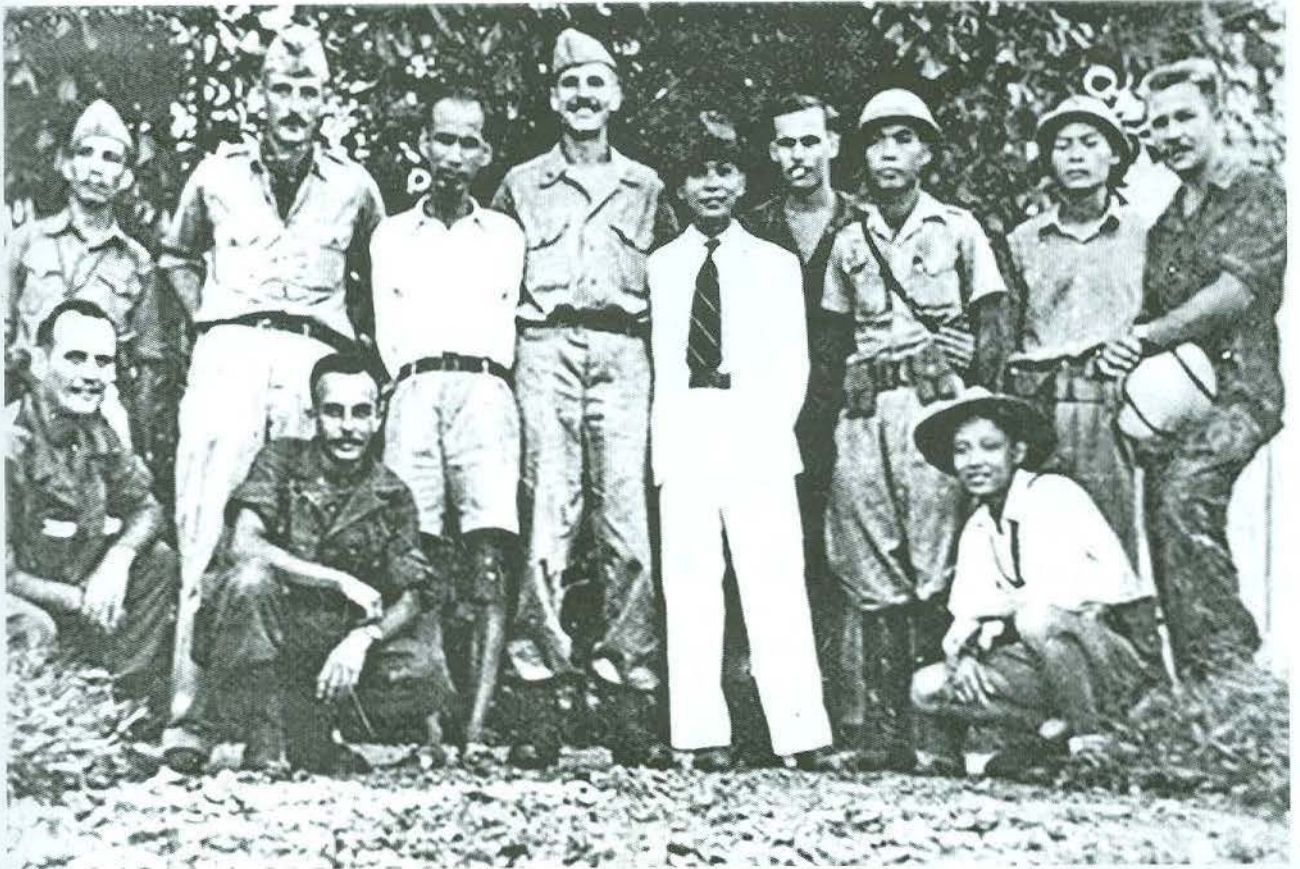
Chủ tịch Hồ Chí Minh, đồng chí Võ Nguyên Giáp cùng một số thành viên nhóm tình báo "Con Nai" Mỹ tại Tân Trào năm 1945.