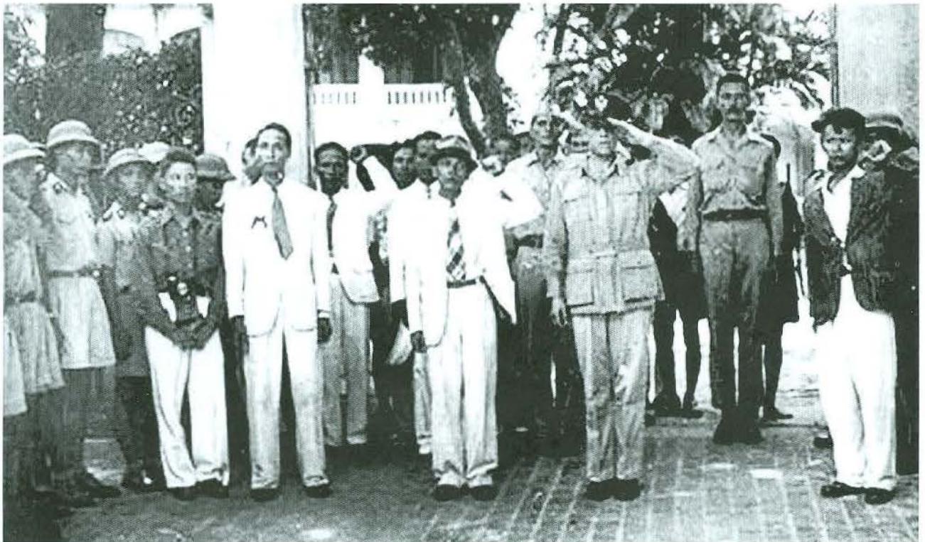
Lễ chào cờ "quốc tế" đầu tiên sau Cách mạng tháng Tám.

Từ quan hệ rất tốt đẹp và hiệu quả với các bạn Mỹ trước Cách mạng tháng Tám, chỉ một tháng rưỡi sau khi nước ta tuyên bố độc lập, ngày 17/10/1945, Chủ tịch Hồ Chí Minh đã cho thành lập Việt - Mỹ thân hữu Hội (nay là Hội Việt Mỹ), tổ chức hữu nghị song phương đầu tiên được thành lập ở nước Việt Nam dân chủ cộng hòa, đồng thời cho xuất bản tạp chí Việt - Mỹ cũng như xây dựng chương mục «Việt Mỹ» hàng tuần trên sóng Đài Tiếng nói Việt Nam... Đặc biệt, trong hai năm 1945 - 1946, với tư cách Chủ tịch nước kiêm Bộ trưởng Ngoại giao Việt Nam dân chủ cộng hòa, Hồ Chí Minh đã có 8 thư và điện gửi Tổng thống Mỹ Harry Truman, 3 thư và điện gửi Bộ trưởng Ngoại giao Mỹ James Byrnes, đề nghị Hợp chúng quốc Hoa Kỳ, với tư cách là những người bảo vệ và bênh vực công lý trên thế giới, ủng hộ nền độc lập hoàn toàn của Việt Nam và hợp tác đầy đủ với Việt Nam.