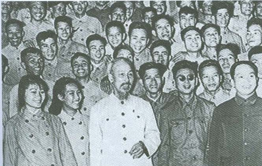
Chủ tịch Hồ Chí Minh chụp ảnh với đại biểu quân đội, thương binh và quân nhân phục viên sau buổi gặp tại Phủ Chủ tịch, 29/1/1957.

(Nguồn Ban quản lý Di tích Chủ tịch Hồ Chí Minh)