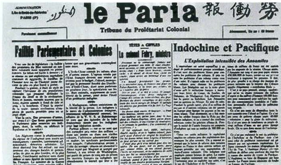
Một số báo Le Paria.

xấu”, “Tu ma đầu bò”, “Nhất trên thế giới”, “Mồ cha không khóc, khóc mồ môi”, “Bán mắt nuôi miệng” đăng báo Cứu quốc năm 1951, Chủ tịch Hồ Chí Minh ký bút danh ĐX, CB mỗi bài cũng dài không quá 100 chữ. Và chính Bác là người khơi xướng thể loại “người tốt việc tốt” từ năm 1942. Nhà báo Nguyễn Ái Quốc - Hồ Chí Minh căn dặn cán bộ báo chí “Viết thể nào cho phổ thông, dễ hiểu, ngắn gọn, dễ đọc”, “tránh dùng chữ nước ngoài”, “tránh viết dây cà ra dây muông”, “tránh viết dài, không hợp với trình độ và thời gian của quần chúng”. Tôn trọng bạn đọc là nguyên tắc viết báo của Người, chính vì vậy, những bài báo ngắn, gọn, súc tích, phong phú thông tin của Người đã có sức cảm hóa chinh phục mãnh liệt, cổ vũ, khích lệ hàng triệu người hành động cách mạng. Lịch sử báo chí cách mạng Việt Nam ghi nhận Bác đến dự Đại hội lần thứ 2, những người báo chí cách mạng ngày 16/4/1959. Tại Đại hội này, Bác chỉ ra những sai sót, khuyết điểm của các nhà báo, các cơ quan báo chí, đăng ảnh trang nhất đẹp nhưng không có nội dung thiết thực, không dùng chữ “vùng trời”, lại dùng chữ “không phận”; chữ “Vẻ vang” rất hay không dùng lại dùng từ “quang vinh”. Đưa tin ngoại giao không bình đẳng, không tinh tế. Đoàn in chữ to, đặt vị trí cao, còn Đoàn khác ghi chữ nhỏ, đặt vị trí thấp hơn. In như thế là thiếu ý thức chính trị, bên trọng bên khinh. Có báo đăng ngớ ngẩn