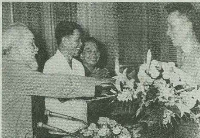
Bác Hồ nhận hoa chúc thọ của đại biểu quân đội, ngày 11-5-1969.

Biết rõ tình trạng sức khỏe của mình và một lòng thương nhớ đồng bào đang ngày đêm chiến đấu gian khổ hy sinh, Bác nhất định không cho làm sinh nhật . Đồng chí Lê Duẩn thay mặt Trung ương xin phép tổ chức sinh nhật cho Bác và