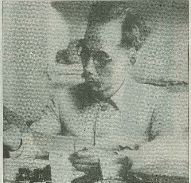
Chủ tịch Hồ Chí Minh làm việc tại Bắc Bộ Phủ, năm 1946.

Vì Bác mời rất đông khách nên phải trải chiếu dưới sàn nhà cho có đủ chỗ ngồi. Bác cũng ngồi xuống cùng các cụ cao niên, quây quần giữa mọi người, thân mật như trong một