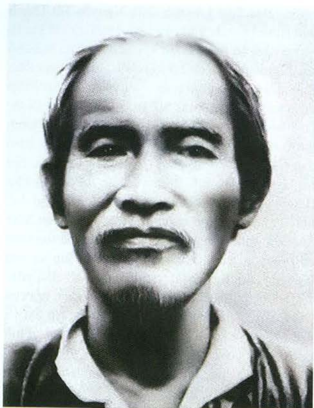
Cù Nguyễn Sinh Sắc - Cha của Bác Hồ