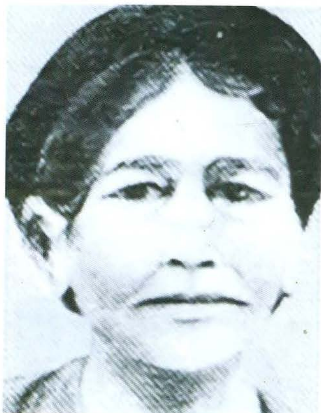
Cù Hoàng Thị Loan - Mẹ của Bác Hồ