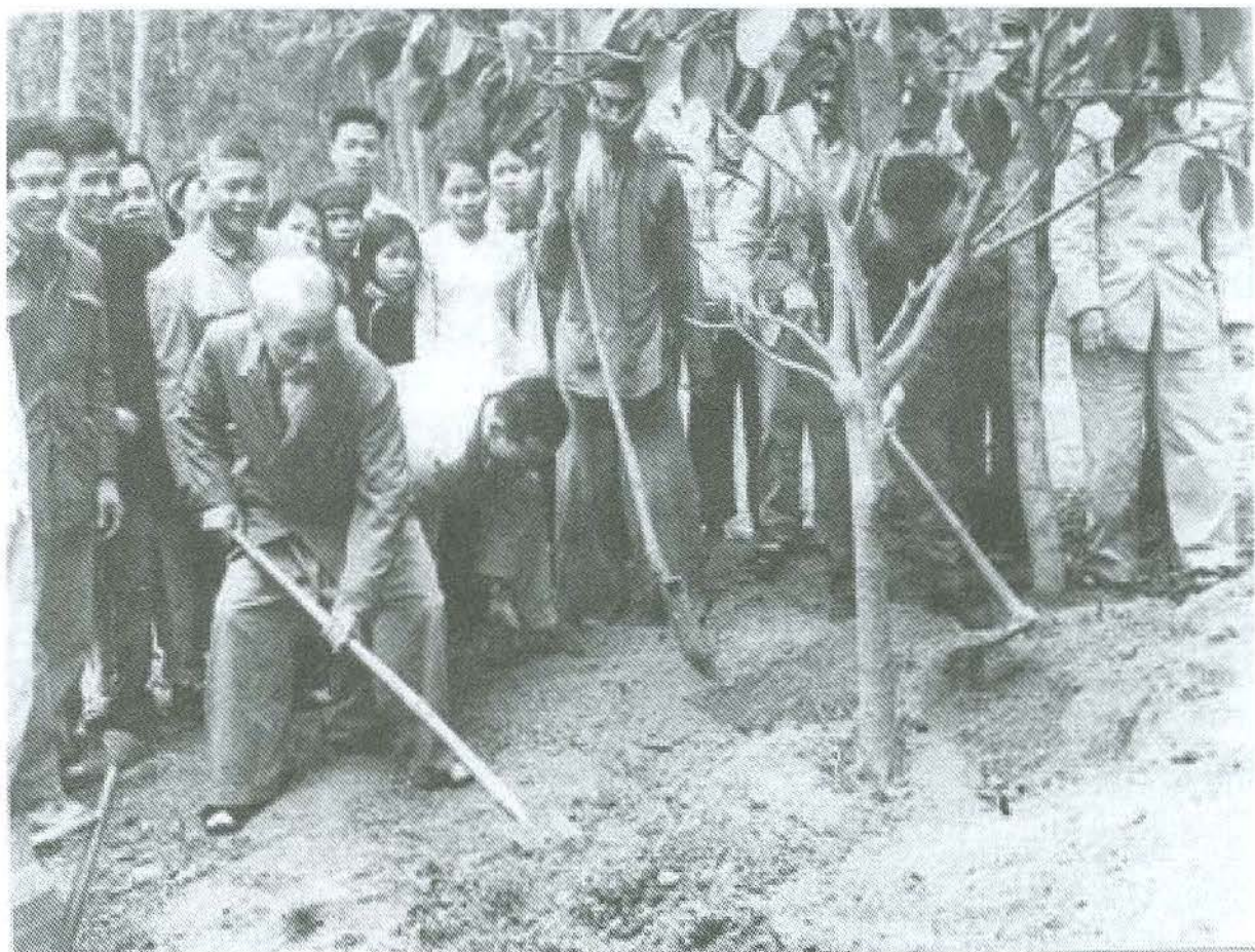
Bác Hồ trồng cây đa trên đồi Đồng Váng (Vật Lại, Ba Vì, Hà Tây)