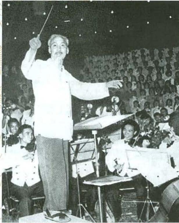
Chủ tịch Hồ Chí Minh bất nhịp bài ca kết đoàn.

- Ham dùng những kẻ khéo nịnh hót mình, mà chán ghét những người chính trực.