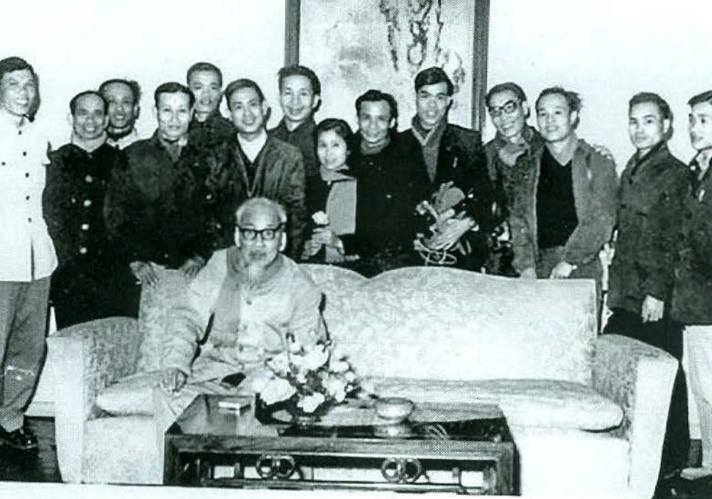
Chủ tịch Hồ Chí Minh và các phóng viên Đài Tiếng nói Việt Nam tại Phủ Chủ tịch (12-1967).