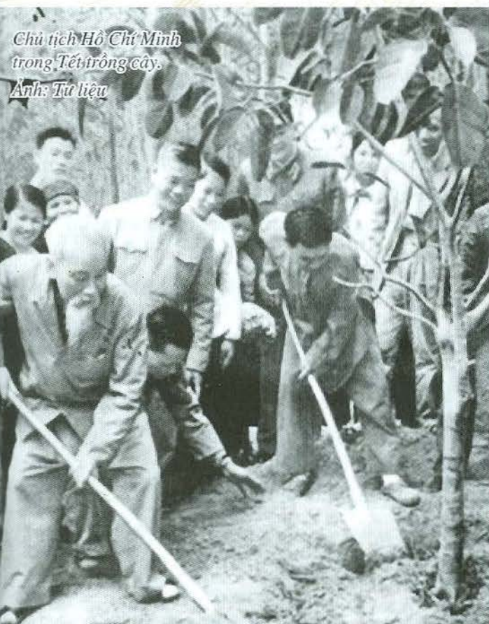
Chủ tịch Hồ Chí Minh trong Tết trồng cây.

- Ham dùng người bà con, anh em quen biết, bè bạn, cho họ là chắc chắn hơn người ngoài.