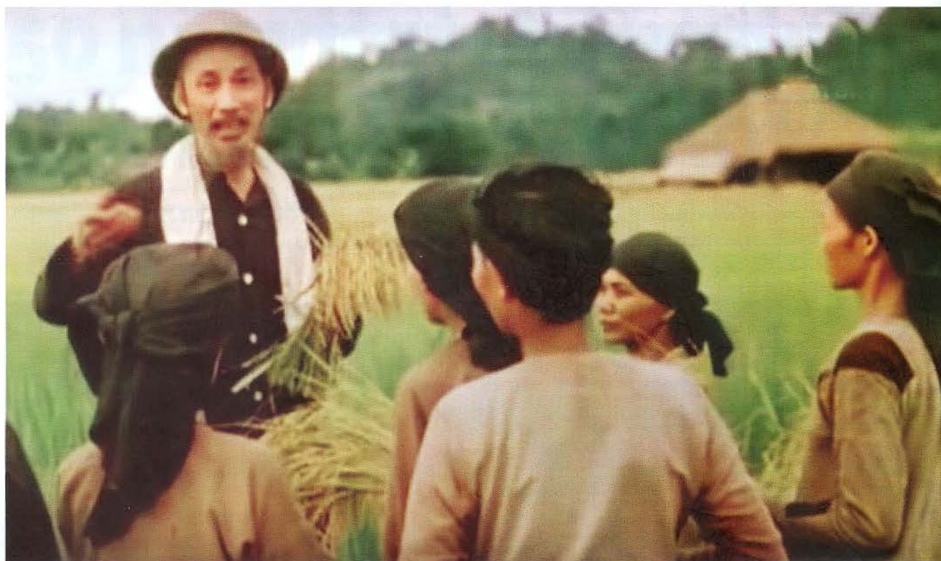
Sinh thời, Chủ tịch Hồ Chí Minh luôn quan tâm và giành tình cảm đặc biệt đến giai cấp nông dân.

con đường xã hội chủ nghĩa trong khi chế độ xã hội chủ nghĩa khủng hoảng và sụp đổ ở nhiều nước. Từ thực tiễn đổi mới, nhận thức về chủ nghĩa xã hội và con đường đi lên chủ nghĩa xã hội ngày càng sáng tỏ hơn. Tổ chức đảng vững mạnh gắn liền với hoàn thiện hệ thống chính trị, tăng cường vai trò lãnh đạo và cầm quyền của Đảng. Trong xây dựng Đảng cũng đã bộc lộ những hạn chế, khuyết điểm đó là một bộ phận cán bộ, đảng viên kể cả cán bộ lãnh đạo suy thoái về tư tưởng chính trị, đạo đức, lối sống, “tự diễn biến”, “tự chuyển hóa” sa vào chủ nghĩa cá nhân, tham nhũng, quan liêu, lãng phí. Đại hội XII của Đảng (1-2016) đặt nhiệm vụ xây dựng Đảng về đạo đức ngang với xây dựng Đảng về chính trị, tư tưởng, tổ chức. Hiện nay, nhiệm vụ xây dựng, chỉnh đốn Đảng đang được thực hiện với những giải pháp đồng bộ theo Nghị quyết T.Ư 4, khóa XII (10-2016), đã và đang đạt được kết quả rất quan trọng gắn liền với thực hiện Chỉ thị số 05-CT/TW, ngày 15-5-2016 của Bộ Chính trị về đẩy mạnh học tập, làm theo tư tưởng, đạo đức, phong cách Hồ Chí Minh và đang được tiếp sức bởi sự đánh giá nghiêm túc, có trách nhiệm 50