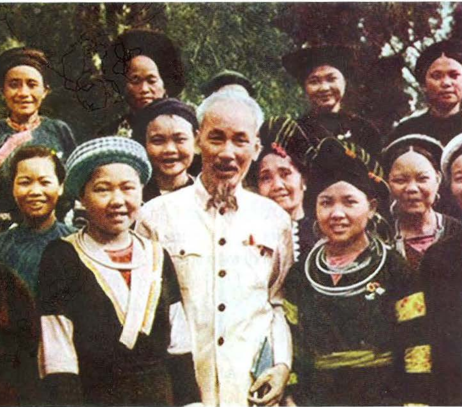
Chủ tịch Hồ Chí Minh với đồng bào các dân tộc thiểu số. (ảnh tư liệu)