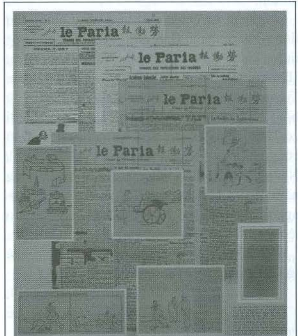
Dấu ấn của Nguyễn Ái Quốc - Hồ Chí Minh trên tờ Le Paria - Tờ báo đầu tiên do Người sáng lập trên đất Pháp

Sự nghiệp báo chí của Chủ tịch Hồ Chí Minh gắn liền với thân thể và sự nghiệp cách