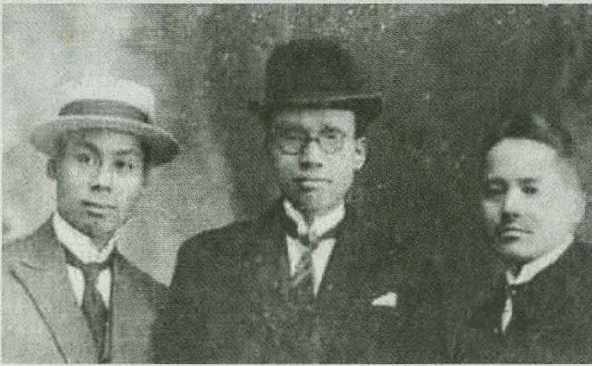
Phạm Duy Tồn, Phạm Quỳnh, Nguyễn Văn Vĩnh tại Pháp năm 1922

và bọn ba ở hải ngoại cũng như còn ở trong lao tù.