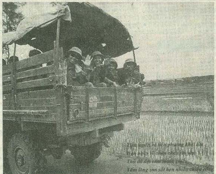
Tiền tuyến ra trận phương Khôi Lân Hàng ngày bị bom đạn tàn sát Thủ đả diệt sam quân thù Lâm đồng sơn sắt thép nhũn nhũn chiến công