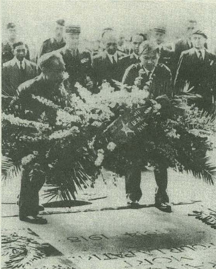
Chủ tịch Hồ Chí Minh đặt vòng hoa viếng các chiến sĩ đấu tranh vì nền độc lập, tự do của nước Pháp ở Khải Hoàn Môn, Paris, Pháp (6-1946)

Xuyên suốt quyển hồi ký, Jean Sainteny nhấn mạnh là các cố gắng giữa Hồ Chủ tịch và ông trong cương vị Ủy viên Cộng hòa Pháp tại Bắc Việt, tức đại diện cho nước Pháp để mưu tính một giải pháp hòa bình với chính phủ Hồ Chí Minh đã thất bại vì phe chủ chiến đang thắng thế và nhất là thái độ thờ ơ kỳ lạ của các chính phủ Pháp lúc bấy giờ. Và cũng hồi ký này Sainteny đặc tả chân dung Hồ Chủ tịch trong những giây phút nghiêm trọng, vận nước như nghìn cân treo sợi tóc. Và đúng như ông nhận định, Bác Hồ là một nhà ngoại giao tài ba và đầy bản lĩnh, từng lời nói đến từng việc làm đều được đong đo cân đếm đến mức chi li để đạt được thành công mong muốn. ■