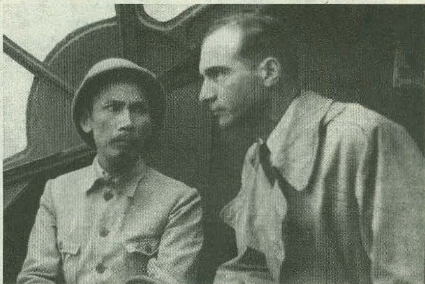
Chủ tịch Hồ Chí Minh và Jean Sainteny năm 1946

Argenlieu ngày 24-3-1946, một phái bộ hữu nghị Việt Nam gồm mười vị đại biểu Quốc hội sang Paris chào thân hữu Quốc hội Pháp. Cùng ngày ấy sẽ mở tại Đà Lạt cuộc hội nghị chuẩn bị cho hội nghị chính thức tại Pháp. Phái đoàn Pháp gồm 12 người dưới quyền Cao ủy Đông Dương. Phái đoàn Việt Nam gồm 12 người dưới quyền